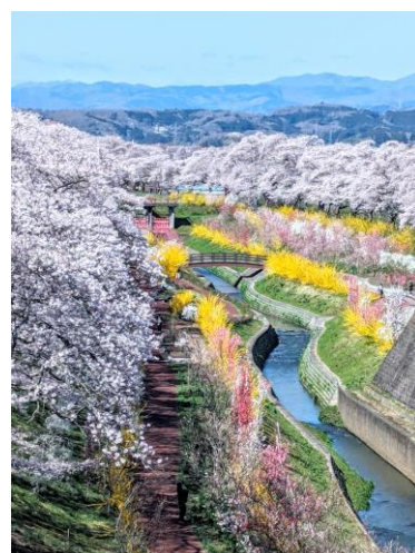
miipekoo様 宮城県 一目千本桜