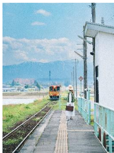
haruka_shimizu様 山形県 フラワー長井線白兔駅