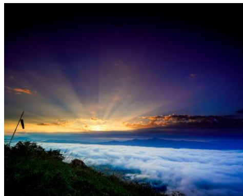
sprout571様 岩手県 高清水展望台