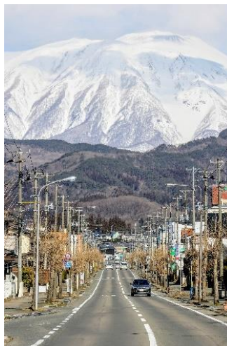
0412_lavie様 岩手県 岩手山