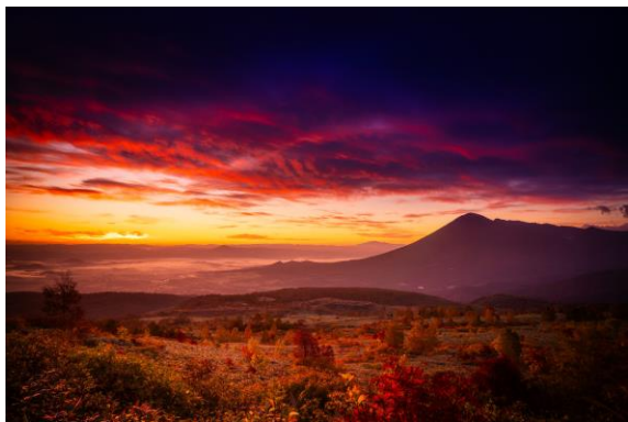
sprout571様 岩手県 八幡平アスピーテライン