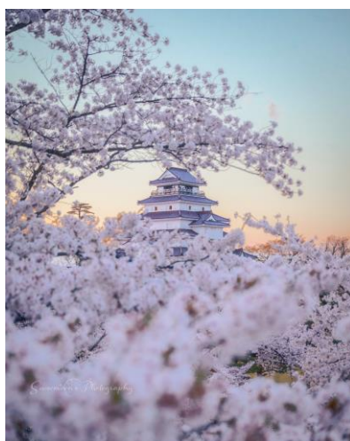
875ex様 福島県 鶴ヶ城