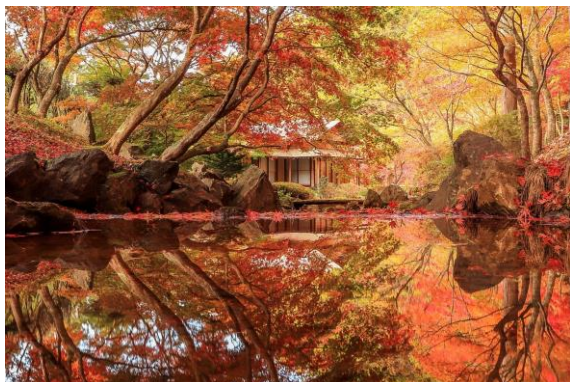
takachanxv7様 青森県 カッコーの森エコーランド