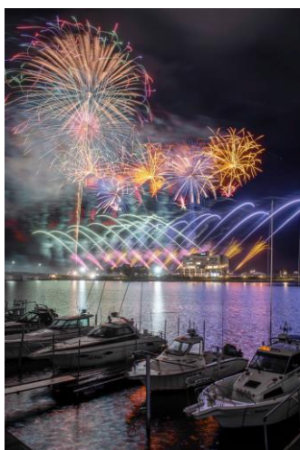
nao_ya様 宮城県 なとり夏まつり